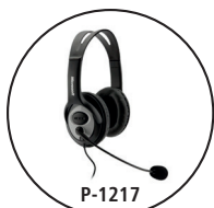
Cuffia per l'operatore