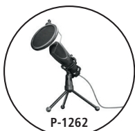
Microfono di ritorno